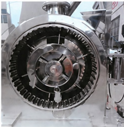
Swing Blade Type