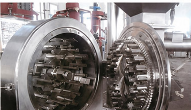
Disc Mill Type