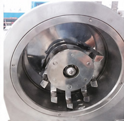
Swing Hammer Type