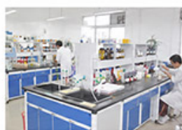
Research &amp; Chemicals